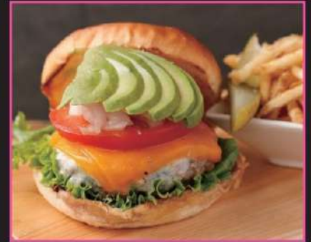
アボカドチェダー キングロード 1,473円 (込1620)