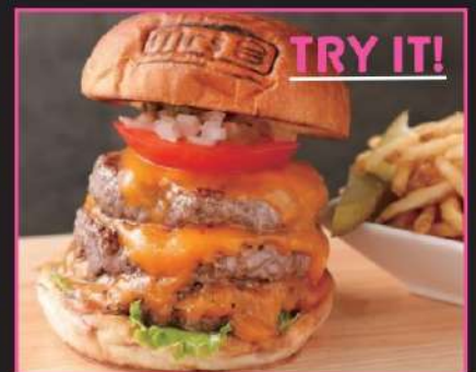
MT.FUJI ~ トリプルチーズバーガー ~ 2,445円 (込2690)

予約配達可・大量注文可。HATAGO COEDOYA にご宿泊の お客様へはお部屋までお運びいたします (1つからOK)。