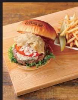
さつまいもKOEDOブルーチーズ 1,627円 (込1790)