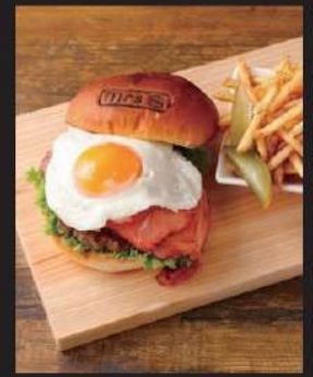
炙りベーコンエッグサワークリーム 1,627円 (込1790)