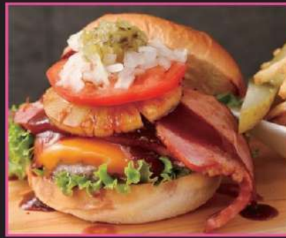
TOKINOKANE ~ トキノカネ ~ 1,773円 (込1950)