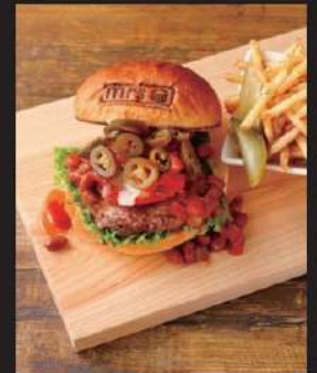
チリビーンズサルサ スパイシー 1,627円 (込1790)