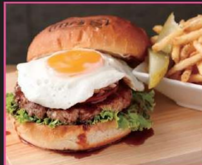
和風テリマヨエッグ 1,473円 (込1620)