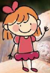
キッズバーガー 973円 (込1070)