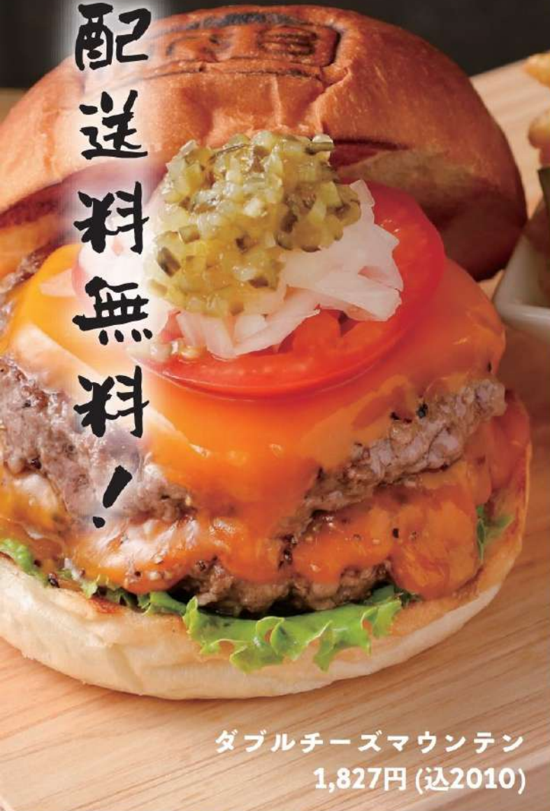
ダブルチーズマウンテン 1,827円 (込2010)