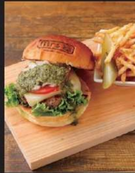
モッツアレラバジル カプレーゼ 1,473円 (込1620)